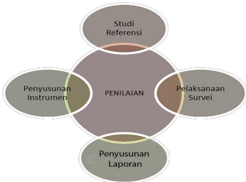
Tabel 1 Model alur penyusunan Survei Kepuasan Masyarakat menuju Zona Integritas

Sebelum tim melakukan survei lapangan, dilakukan beberapa tahapan agar instrumen yang dipergunakan dapat diaplikasikan sesuai realitas lapangan. Adapun alur penyusunan untuk Survei Persepsi Kualitas Pelayanan (SPKP) dan Survei Persepsi Anti Korupsi (SPAK) ini dapat digambarkan dalam bagan di bawah ini: