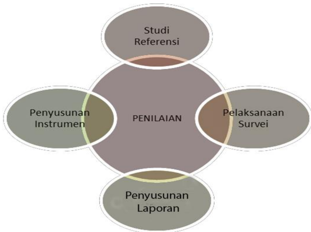
Tabel 1 Model alur penyusunan Survei Kepuasan Masyarakat menuju Zona Integritas

Sebelum tim melakukan survei lapangan, dilakukan beberapa tahapan agar instrumen yang dipergunakan dapat diaplikasikan sesuai realitas lapangan. Adapun alur penyusunan untuk Survei Kepuasan Masyarakat (SKM) dan Survei Persepsi Anti Korupsi (SPAK) ini dapat digambarkan dalam bagan di bawah ini: