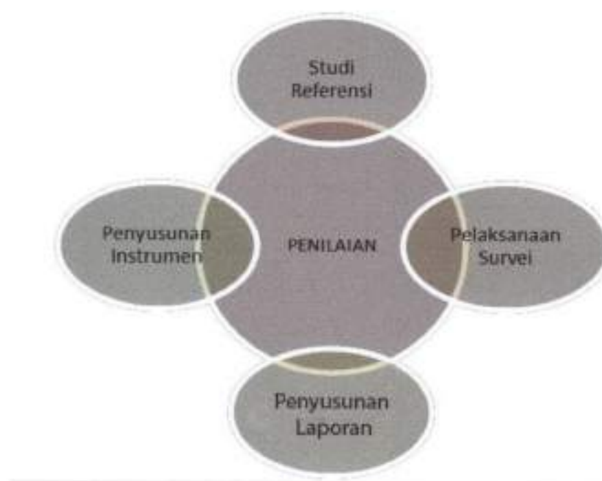
Tabel 1 Model alur penyusunan survei IPK menuju Zona Integritas

Sebelum tim melakukan survei lapangan, dilakukan beberapa tahapan agar instrumen yang dipergunakan dapat diaplikasikan sesuai realitas lapangan. Adapun alur penyusunan tools untuk survei persepsi korupsi ini dapat digambarkan dalam bagan di bawah ini: